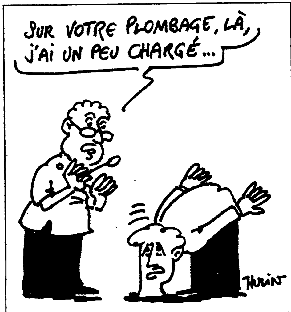
(Dessin de M.HULIN)

G. VITHOULKAS précise que l'idée maîtresse chez Mercurius, c'est le manque de pouvoir réactif associé à une instabilité ou une déficience fonctionnelle :